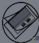
当护卡膜大小不合适时(图A)